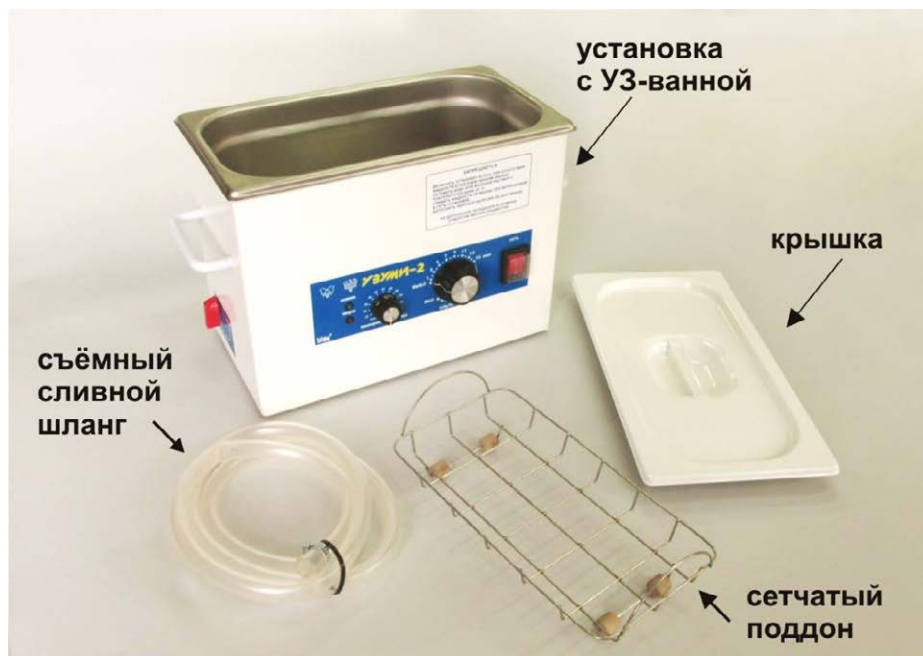
Рис.1. Внешний вид установки и комплект её поставки.