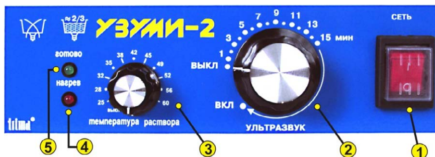
Рис.2. Панель управления установки "УЗУМИ-2".