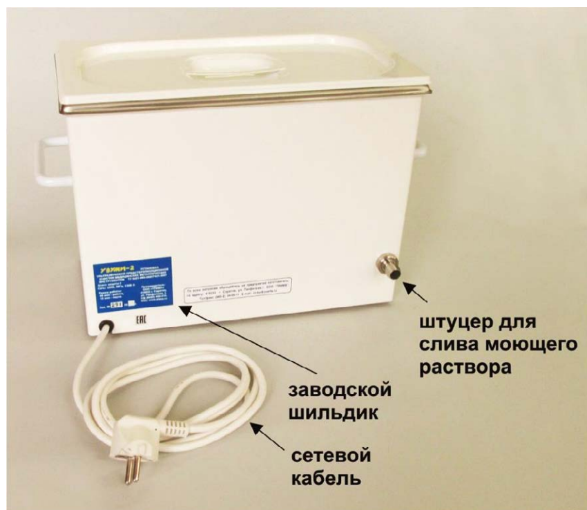
Рис.4. Элементы конструкции задней стенки корпуса установки "УЗУМИ-2".

На задней стенке корпуса (Рис.4) в противоположном от сливного штуцера углу находится вывод сетевого кабеля, а над ним заводской шильдик с серийным номером установки и годом её выпуска.